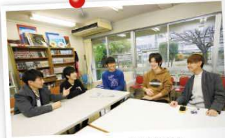
コミュニケーションに富んだ寮生活 国際基督教大学(ICU)高等学校