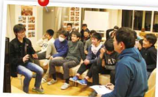
企業より派遣されるフロアマスターとの交流 海陽中等教育学校