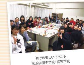
寮での楽しいイベント 茗溪学園中学校・高等学校