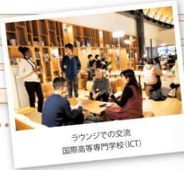
ラウンジでの交流 国際高等専門学校(ICT)