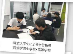
筑波大学生による学習指導 茗茶学園中学校・高等学校