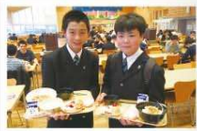
海陽中等教育学校