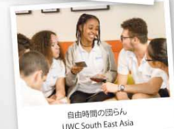
自由時間の団らん UWC South East Asia