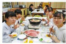
札幌聖心女子学院中学校・高等学校

学校がある日は朝・昼・夕食提供されるのはもちろん、ほとんどの寮が休日にも食事を提供しているようです。