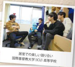
居室での楽しい語り合い 国際基督教大学(ICU) 高等学校