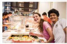
UWC South East Asia