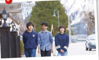
自由時間の様子 スイス公文学園高等部