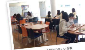
明るい食堂での楽しい食事 土浦日本大学高等学校