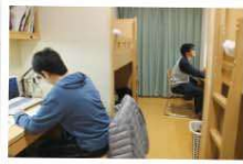
自習の様子 同志社国際中学校高等学校