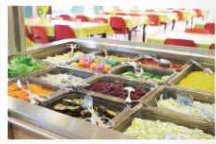
スイス公文学園高等部