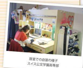
居室での自習の様子 スイス文学園高等学校

寮生活では、自分で判断し行動しなければならぬため、冷静に自身を見つめることができたようです。また、同級生は日本全国、海外から集まっているので、さまざまなバックグラウンドの同級生と友情を深めていました。社会性や忍耐力も身につけ、良い経験になりました。