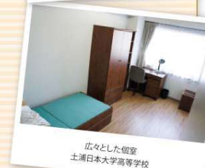
広々とした個室 土浦日本大学高等学校