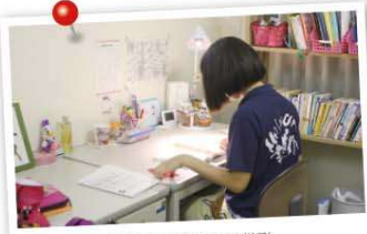
沈黙の時間(自習時間の様子) 茗溪学園中学校高等学校