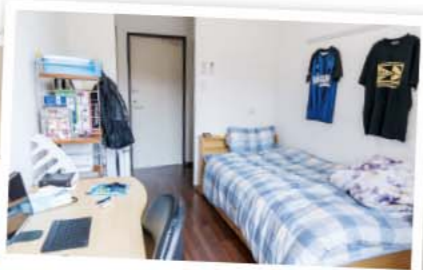
プライベートが守られた個室 関東学院六浦中学校・高等学校