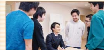
自身のキャリアを考えるきっかけになる

12棟の各ハウスでは、社会経験豊富なハウスマスター(寮監)が「お父さん役」、さらに一流企業から派遣された若手社員が各階のフロアマスターとして「お兄さん役」を務め、生徒とともに生活し、社会人の先輩として日常的に交流しながら生徒たちの成長を促していきます。