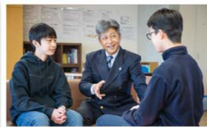
ハウスマスターとのひと時 海陽中等教育学校