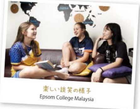
楽しい談笑の様子 Epsom College Malaysia