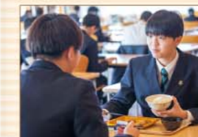
3食バランスの取れた、できたての食事が味わえる

三河湾を臨むオーシャンビューの食堂では専属の栄養士がバランスを考えたメニューを用意。有名店とのコラボメニューなども提供するほか、アレルギーをもつ生徒への個別対応やスポーツに打ち込む生徒向けのプラスワンメニューなど、きめ細やかに対応します。