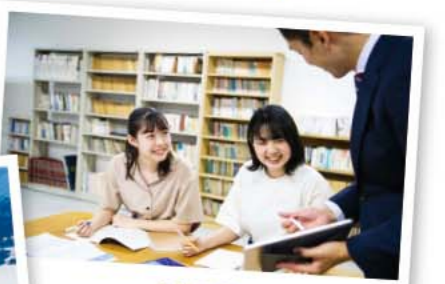
自習風景 立命館宇治中学校・高等学校