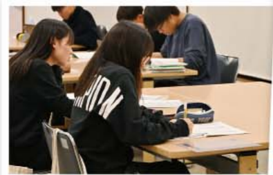
日々の学習時間 啓明学院高等学校