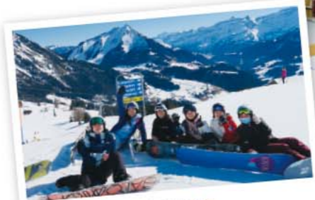
大自然を満喫 スイス公文学園高等部