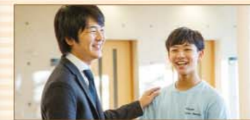
なんでも相談できる存在