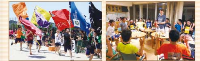
スポーツフェスタ