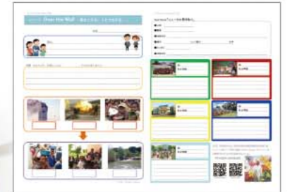
「総合学習」ワークシートの一例