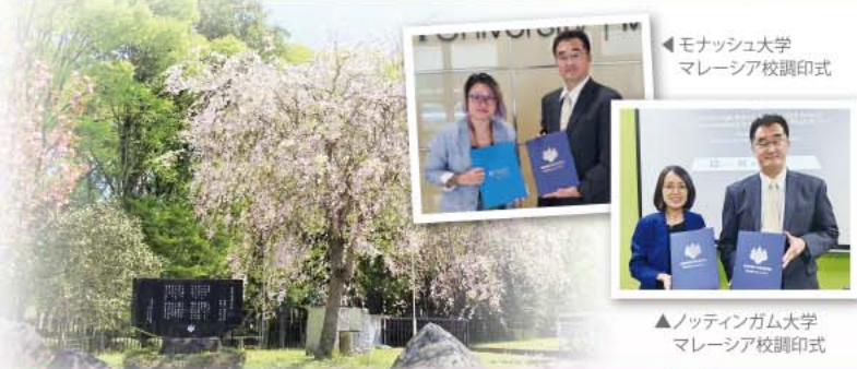
◀モナッシュ大学 マレーシア校調印式