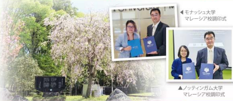
◀モナッシュ大学 マレーシア校調印式