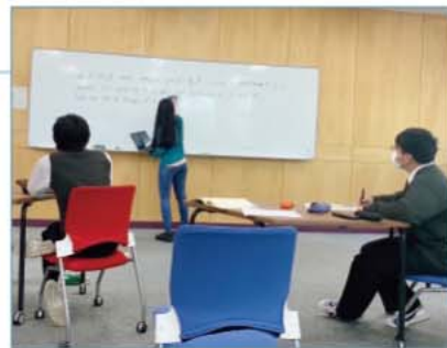
ケンブリッジ国際A Level、IGCSEなどの国際教育プログラムをオンラインで提供する「Nisai」インターナショナルスクールと提携(一条校として初)。