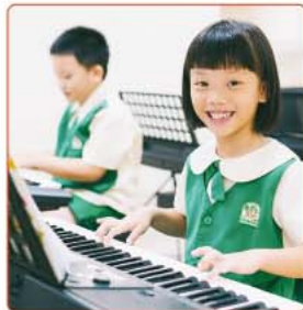
脳の発達を効果的に促す人気の「音楽プログラム」

当園のカリキュラムは「K.I.N.D.E.R」に基づき、さまざまな分野を垣根なく学べるよう構成されています。子どもたちは五感をフルに使いながら、学びを深めていきます。さらに遠足や多彩なエンリッチメント・プログラムで視野を広げていきます。