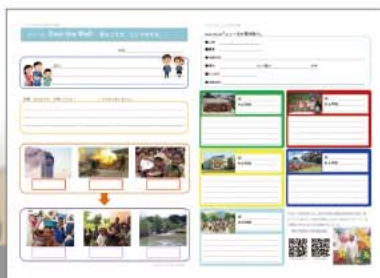
「総合学習」ワークシートの一例