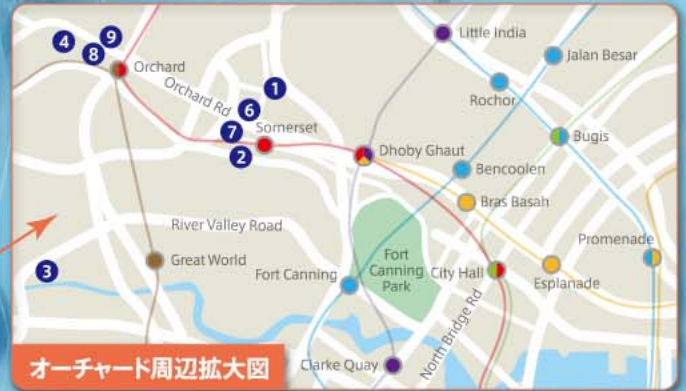
オーチャード周辺拡大図