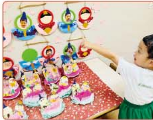
日本語を学ぶだけでなく日本文化に親しむプログラム

A マリンパレード校では、日英の「バイリンガル・プログラム」があり、日本語は日本語を母語とする教員、英語は専任の教員が毎日指導します。「日本語クラス」は、日本語を学ぶだけでなく、日本の伝統文化や季節の行事に親しむことで日本人としてのアイデンティティがしっかりと確立するよう導いています。例えば2月には「節分」、3月には「ひなまつり」のお祝いをするなど、年間を通じて日本の年中行事に触れることができます。また、「旧正月」や「ハリラヤ」、「ディパバリ」などシンガポールの代表的な伝統行事もお祝します。