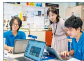
「母語としての日本語クラス」で学ぶG10の在校生

本校では、生徒の約25%が日本語を含む多様な言語で「バイリンガルIBディプロマ」を取得して卒業しています。また、多くの生徒が日本の名門大学に進学しています。