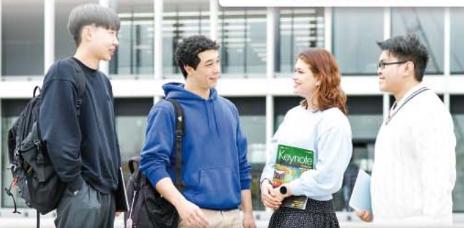
武蔵野キャンパス