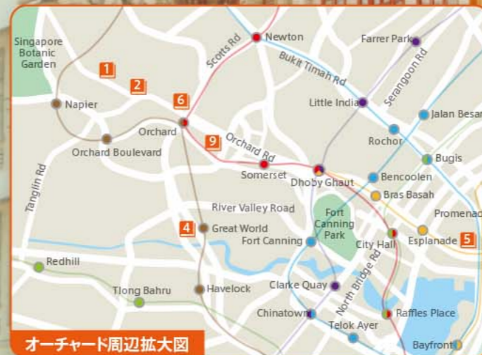
オーチャード周辺拡大図

新生活を始めるご家族の皆さま、シンガポールへようこそ! 教育立国であるシンガポールには魅力あふれる教育機関(園・学校・学習塾・教室)が多数あります。国際的な環境で多文化に親しみ革新的な学びや多言語に触れながら、日本語や日本人としてのアイデンティティも育むことができるここシンガポールで、ぜひ充実した生活をお過ごしください。