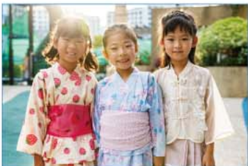
UNデー(イースト・キャンパス)

UWC South East Asia (UWCSEA) においても同様に、多様な背景を持つ生徒を受け入れ、母語や文化的アイデンティティを維持できるよう、さまざまな道筋を用意しています。